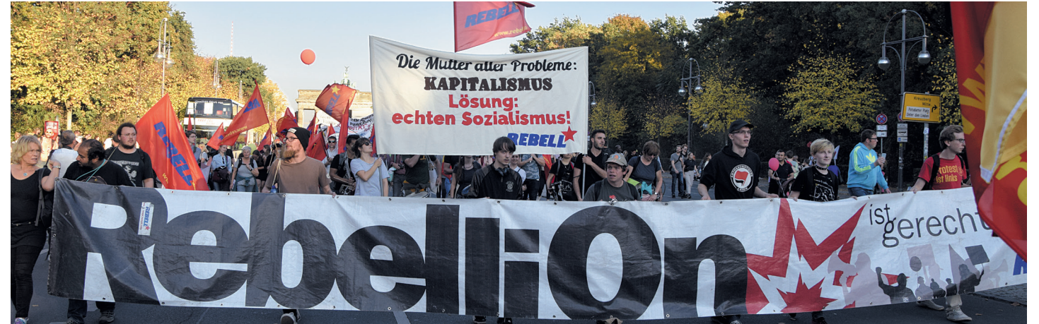
Mit ihrem Jugendverband REBELL organisiert die MLPD die Rebellion der Jugend – und nimmt die Mutter aller Probleme ins Visier

– unisono erheben sie die Forderung nach antikomunistischer Ausgrenzung. Am Tag nach der Demonstration #unteilbar gibt Bild die Losung aus „Teilt euch!“ aus, als Auftakt einer dann folgenden Artikelserie, und sie fordert den Ausschluss angeblicher „Extremisten“ und „Antisemiten“. Wer konsequent die Rechtsentwicklung der Bundesregierung bekämpft, wird zum Extremisten erklärt. Wer – mit vielen Israelis gemeinsam – die faschistoide Politik der Netanjahu-Regierung kritisiert, wird als „antisemitisch“ diffamiert. Absurde Anschuldigungen werden ins Feld geführt: Verwerflich ist schon das von der demokratischen Bewegung hart erkämpfte Recht, Flaggen und Symbole zu zeigen, wahrzunehmen oder Kundgebungen und Informationsstände durchzuführen. Sollen hier Zustände wie in Ungarn oder Polen eingeführt werden, wo kommunistische Flaggen und Symbole verboten sind und rigoros unterdrückt werden?