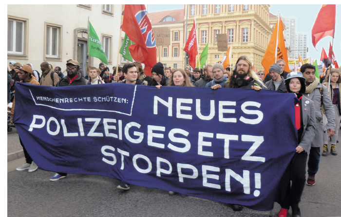
Tatsächlich unteilbar und gleichberechtigt – das Brandenburger Bündnis #noPolBbg bei der Demonstration in Potsdam am 11. November

Programm der Marxistisch-Leninistischen Partei Deutschlands farbig, mit vielen Bildern, Format DIN A6 Selbstkostenpreis: 1,00 Euro Bestellungen an: Verlag Neuer Weg Alte Bottroper Str. 42, 45356 Essen Telefon: 0201 25915 E-Mail: vertrieb@neuerweg.de