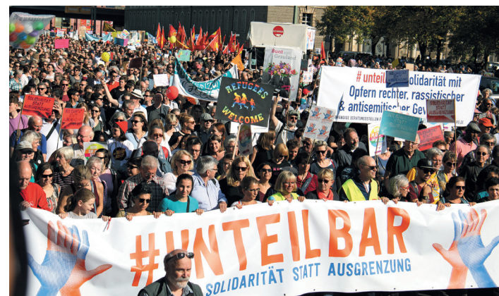
#unteilbar, 13. Oktober in Berlin: Fast eine halbe Million gegen die Rechtsentwicklung der Regierung – und die Bandbreite von Religion bis MLPD

5. Insbesondere die Breite „von Religion bis Revolution“ bringt die Reaktion in Wallung. Seien es die AfD-Chefs Jörg Meuthen oder Björn Höcke, die FDP, der Bund deutscher Kriminalbeamter oder die Bild -Zeitung