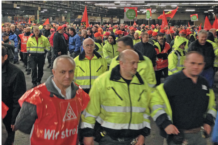
1,2 Millionen Arbeiter in gewerkschaftlichen Tarfkämpfen sind der Ausgangspunkt der kämpferischen Entwicklung (Warnstreik bei Ford Köln)

Bandbreite der Teilnehmerinnen und Teilnehmer – die TAZ formuliert treffend: „Von der Kirche bis zur MLPD“.